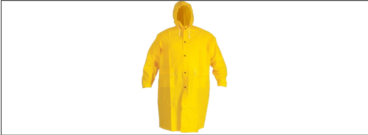
Impermeable Tipo Gabardina por cada guardia.